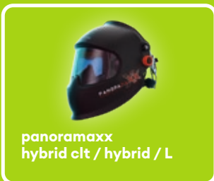
panoramaxx hybrid clt / hybrid / L