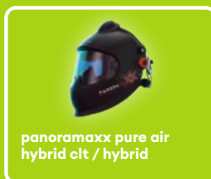
panoramaxx pure air hybrid clt / hybrid