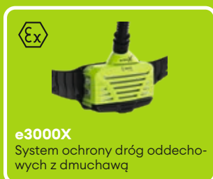
e3000X System ochrony dróg oddechowych z dmuchawą