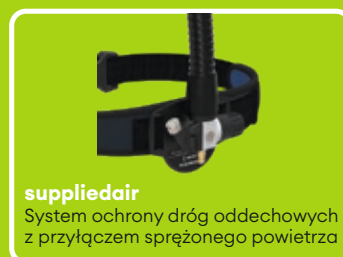
suppliedair System ochrony dróg oddechowych z przyłączem sprężonego powietrza