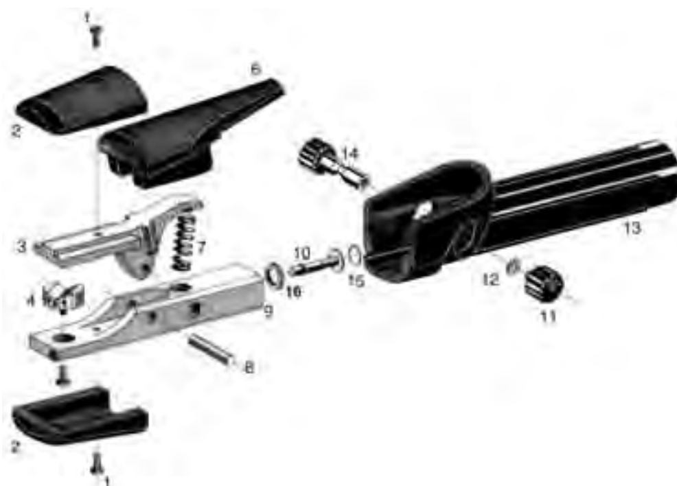
Części zamienne do Flair 600 Rys. 22